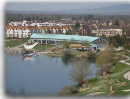
Bürgerhaus am Seepark in Freiburg